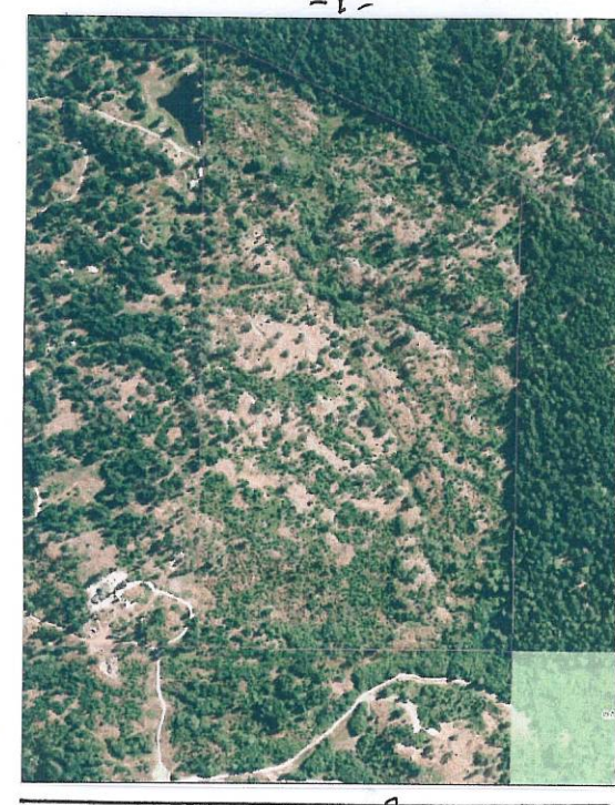
Andreas Vogt Nature Reserve